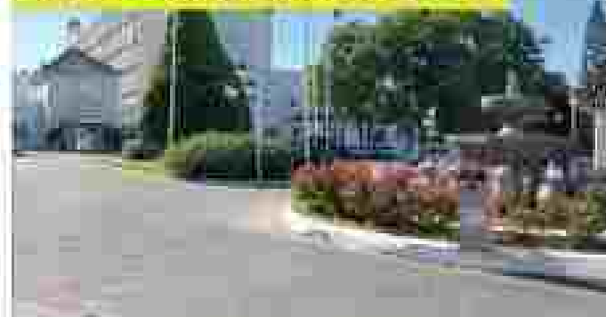
HOTEL ABADES CATEGORÍA: PRIMERA