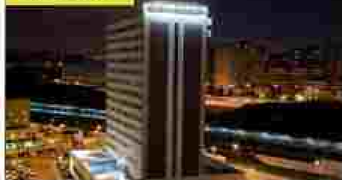
VIP ZURIQUE CATEGORÍA: TURISTA SUPERIOR

En caso de no contar con la disponibilidad en los hoteles previstos sus servicios serán confirmados en un hotel de