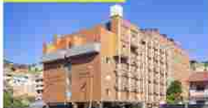
MACIÁ REAL ALHAMBRA CATEGORÍA: PRIMERA