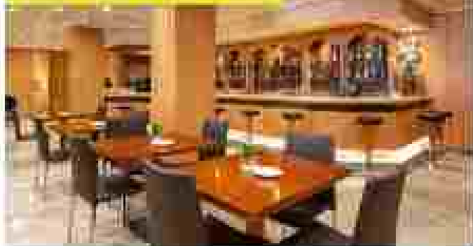
HOTEL PRAGA CATEGORÍA: TURISTA SUPERIOR